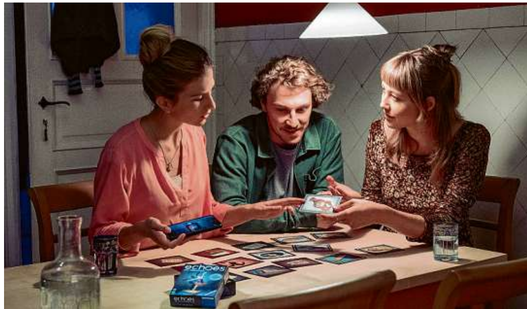
Hier sind feines Gespür und Gehör gefragt.

Bis zu sechs Spieler ab 14 Jahren versuchen in der neuen interaktiven „Hör-Spiel“-Reihe „echoes“ (Ravensburger) jeweils einen mysteriösen Fall zu rekonstruieren. Sie müssen den Echos der Vergangenheit lauschen, um zu verstehen, was passiert ist. Das Besondere daran: Es wird dabei weitestgehend auf bildliche Darstellungen verzichtet – die mysteriöse Spielwelt entsteht über Sound wie Musik, Ton und Sprache. Lediglich 24 stimmungsvoll illustrierte Karten liefern bruchstückhafte, teils versteckte Hinweise. Hinter jeder Abbildung stecken essenzielle Geräusche oder Teile eines Gesprächs. Mit der kostenlosen „echoes“-App können die Spieler diesen lauschen, sobald sie ihre Handycamera über das Spielmaterial bewegen. Dann gilt: Ganz genau hinhören, alle Details wahrnehmen und Gehörtes mit Gesehenem kombinieren. Das Spiel ist in sechs Kapitel unterteilt, denen die Spieler die jeweils drei richtigen Objektkarten zuordnen müssen – und das natürlich in der richtigen Reihenfolge. Haben sie diese gelöst, gilt es, am Ende noch alle sechs Kapitel in die richtige Reihenfolge zu bringen. Wer das schafft, erfährt, welche rätselhaften, spannenden Geschichte sich zugetragen hat. Hierbei gibt es zwei Schwierigkeitsstufen: Einsteiger beginnen mit der Hälfte der Objektkarten. Erfahrene „echoes“-Ermittler steigen direkt mit allen 18 Objektkarten ein. In beiden Fällen