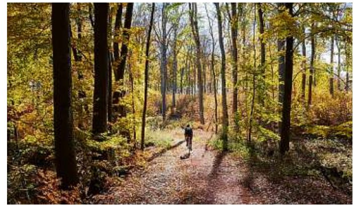
Radfahren im Herbst